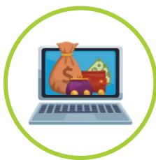
BANCA POR INTERNET