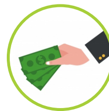
EN EL COLEGIO