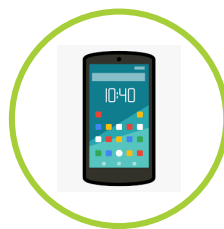
BANCA POR CELULAR